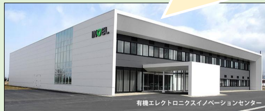
有機エレクトロニクスイノベーションセンター